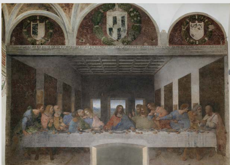
Leonardo da Vinci, Ultima Cena, 1494-1498

È l'opera milanese più nota di Leonardo, che la dipinge per il refettorio di Santa Maria delle Grazie tra il 1495 e il 1498. L'artista rappresenta l' Ultima Cena raffigurando Gesù mentre annuncia che uno dei discepoli lo avrebbero tradito e rappresenta, in modo del tutto originale, le loro reazioni. In gesti ed espressioni riconosciamo la paura, il dolore e lo stupore provato dopo la notizia. Leonardo dipinge il Cenacolo con una tecnica simile alla pittura su tavola, molto fragile, che ne ha causato il degrado.