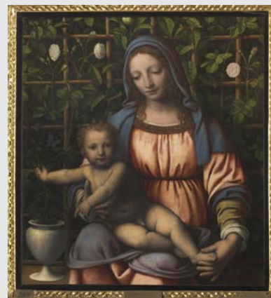
sopra: Bernardino Luini, Madonna col Bambino (Madonna del Roseto) , 1500-1510 a fianco: Maestro della Pala Sforzesca, Madonna in trono col Bambino, Dottori della Chiesa e la famiglia di Ludovico il Moro (Pala Sforzesca) , 1494-1495