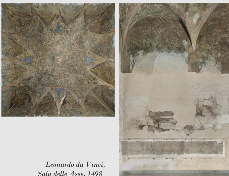
Leonardo da Vinci, Sala delle Asse, 1498

Nel 1498 Leonardo trasforma la Sala delle Asse, chiamata così perché allora foderata di assi lignee, in un fantastico pergolato di gelsi aperti sul cielo. Il Gelso, in latino morus , celebra il committente dell'opera, Ludovico il Moro signore di Milano, e la floridezza economica del suo Ducato, prosperante grazie alle seterie. Tra le sedici piante di gelso, delle corde dorate si intrecciano nei cosiddetti "nodi vinciani" che alludono, come lo stemma sul soffitto, al matrimonio di Ludovico il Moro con Beatrice D'Este. Della sala, scoperta solo nell'Ottocento e lasciata incompiuta da Leonardo, rimangono oggi, oltre alla decorazione del soffitto, alcune porzioni di disegno sulle pareti, esito dei restauri ancora in corso.