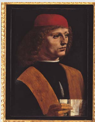
Leonardo da Vinci, Ritratto di Musico , 1485 circa

La Biblioteca Ambrosiana conserva, invece, i 1119 fogli autografi raccolti nel Codice Atlantico, nome derivato dalla grandezza delle pagine degli antichi atlanti sui quali, per esigenze di conservazione, sono stati incollati i fogli leonardeschi. L'opera contiene disegni, appunti e schizzi che spaziano dall'architettura, all'ingegneria bellica, fino ai preziosi disegni di presentazione destinati ai committenti. Cosa meglio del corpus può testimoniare l'abilità e la genialità "universale" di Leonardo?